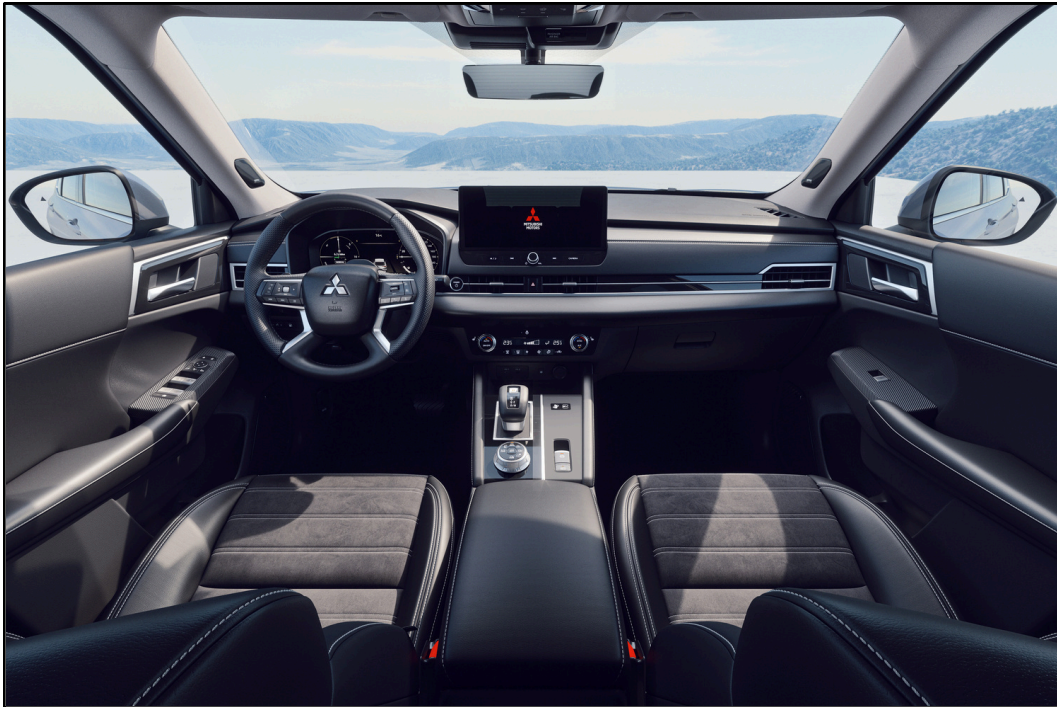
Musta kangas- /keinonahkaverhoilu Saatavilla varustetasoissa Invite & Intense